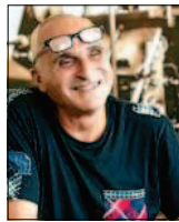
Von José F. A. Oliver.